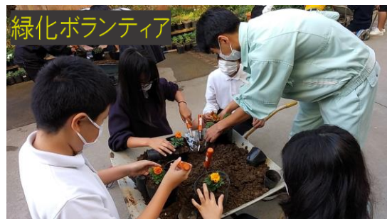
緑化ボランティア